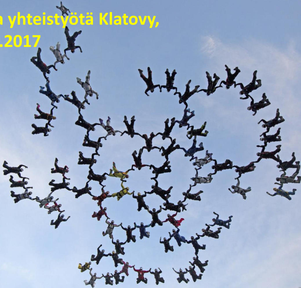
Finnish National Record 80-way, SE 2017, Skydive Pink Klatovy